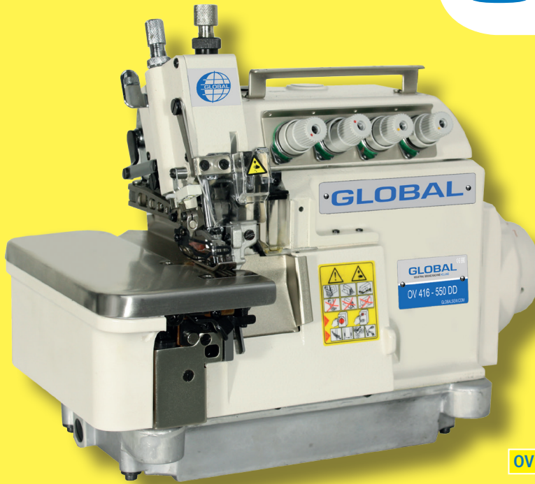
OV 416-550 DD